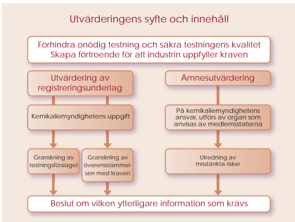
Figur 2: Utvärderingsförfaranden inom REACH-systemet