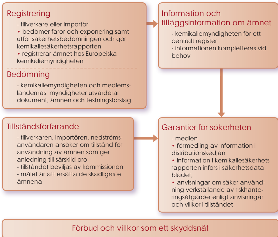
Figur 1: Förenklat schema över REACH-systemet